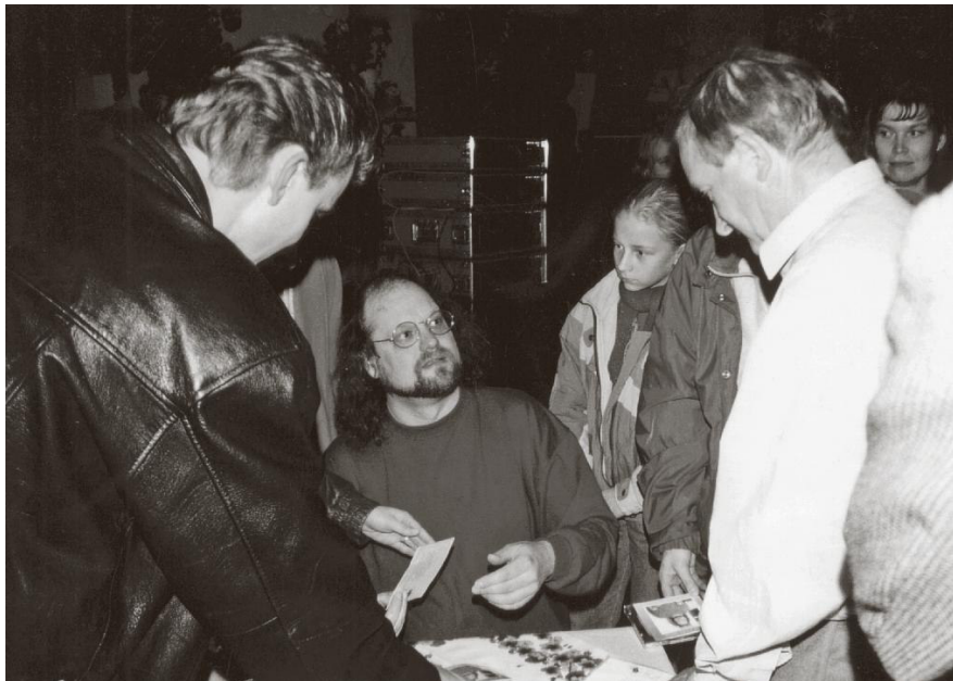
Autogrammstunde anlässlich des Erscheinens der CD Leiser als laut (1994)

In den 2000er Jahren erschienen eine Live-CD und weitere Compilations bis zu der bereits mehrfach erwähnten 5-CD-Box Holger Biege – Die Original-Alben aus dem Jahr 2013.